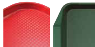
Diseño de perfil alto